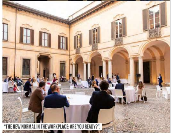
"THE NEW NORMAL IN THE WORKPLACE: ARE YOU READY?".