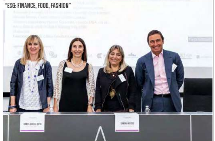
"ESG: FINANCE, FOOD, FASHION"