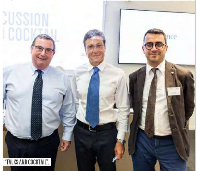
"TALKS AND COCKTAIL".