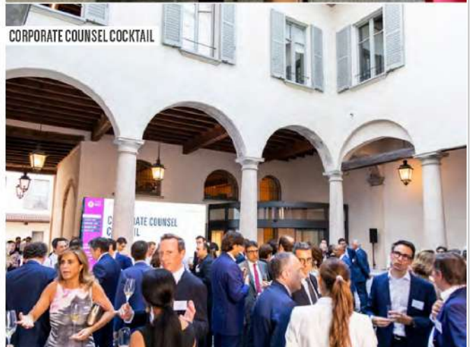
CORPORATE COUNSEL COCKTAIL

La proprietà intellettuale è riconducibile alla fonte specificata in testa alla pagina. Il ritaglio stampa è da intendersi per uso privato