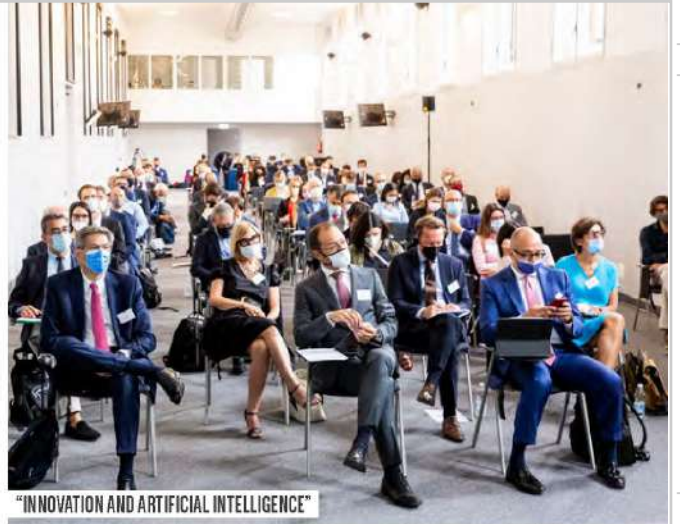
"INNOVATION AND ARTIFICIAL INTELLIGENCE"