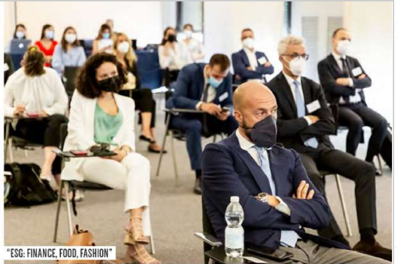
"ESG: FINANCE, FOOD, FASHION"

Dopo la serata di gala svoltasi al WJC per la settima edizione dei Legalcommunity Corporate Awards , la quinta edizione della Legalcommunity Week si è chiusa con i saluti agli ospiti internazionali giunti a Milano da tutto il mondo per partecipare all'appuntamento che anche in questa occasione si è confermato un punto di riferimento per l' avvocatura d'affari e il mercato.