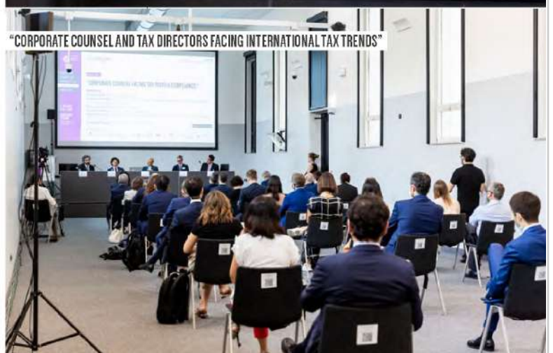
"CORPORATE COUNSEL AND TAX DIRECTORS FACING INTERNATIONAL TAX TRENDS"