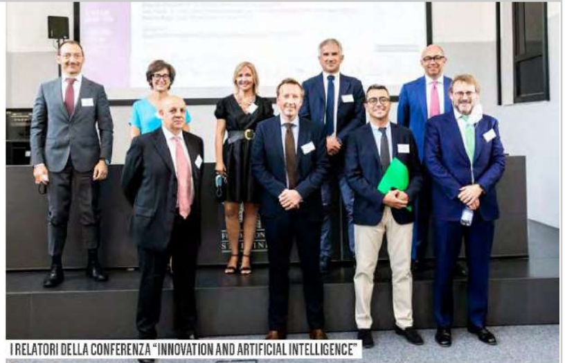
I RELATORI DELLA CONFERENZA "INNOVATION AND ARTIFICIAL INTELLIGENCE"

La quinta edizione della Legalcommunity Week si è aperta il 5 luglio alla Fondazione Stelline di Milano con una conferenza sul tema "Innovation and Artificial Intelligence". Ad aprire i lavori, i saluti di