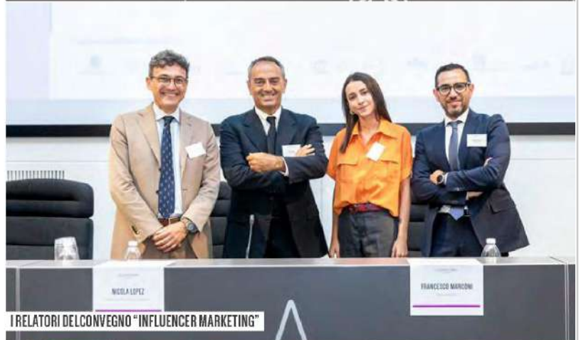
I RELATORI DEL CONVEGNO "INFLUENCER MARKETING"