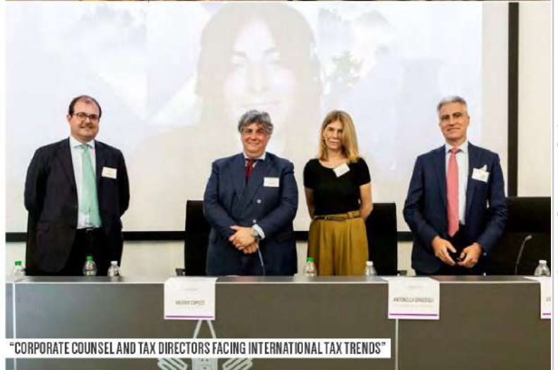
"CORPORATE COUNSEL AND TAX DIRECTORS FACING INTERNATIONAL TAX TRENDS"