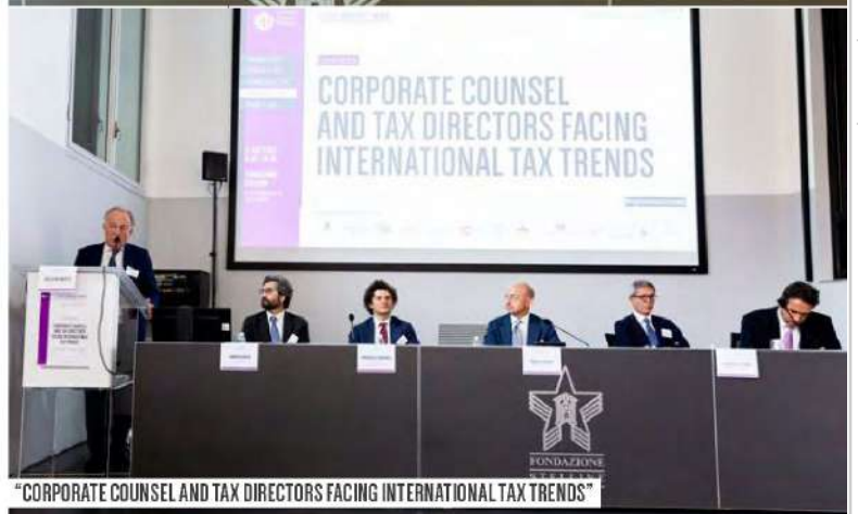
"CORPORATE COUNSEL AND TAX DIRECTORS FACING INTERNATIONAL TAX TRENDS"