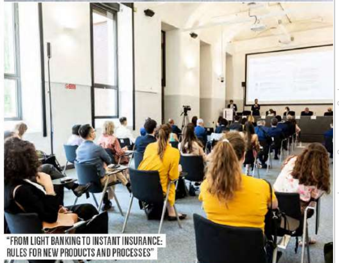
"FROM LIGHT BANKING TO INSTANT INSURANCE: RULES FOR NEW PRODUCTS AND PROCESSES"