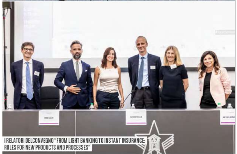
I RELATORI DEL CONVEGNO "FROM LIGHT BANKING TO INSTANT INSURANCE: RULES FOR NEW PRODUCTS AND PROCESSES"